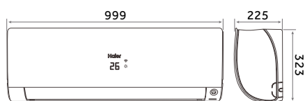
1U25S2SM1FA / 1U35S2SM1FA